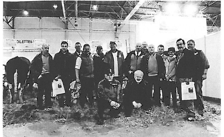
Maine-Anjou-Züchter zu Besuch der Agrimax in Metz.